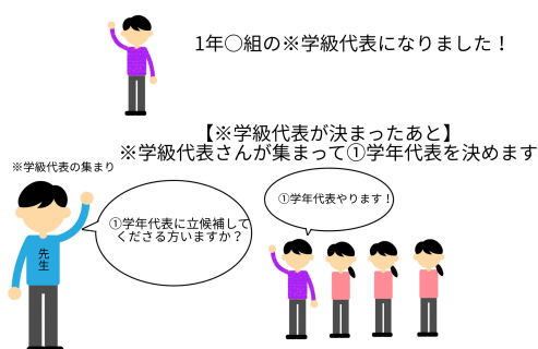
学級代表部の組織図