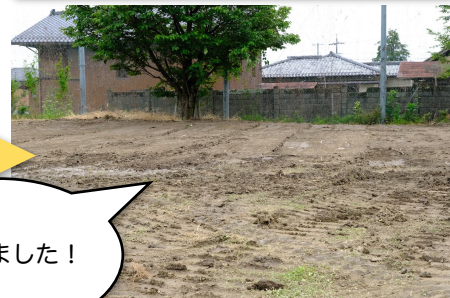
こんもりグラウンド隅 作業後