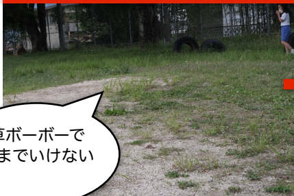
第1グラウンド 作業前