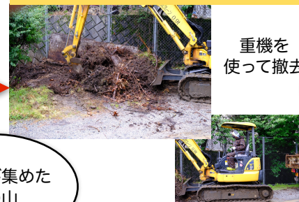
学校草捨て場 作業中