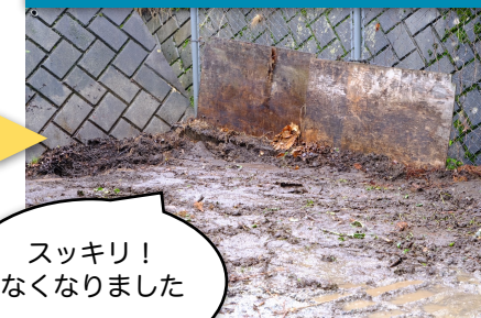
学校草捨て場 作業後