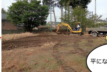
こんもりグラウンド隅 作業中