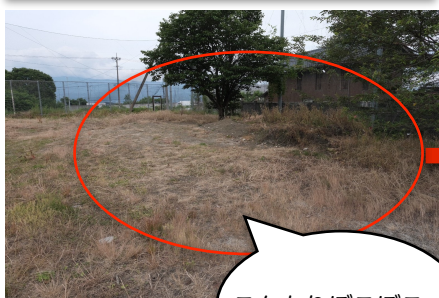
こんもりグラウンド隅 作業前

6月11日（日）前夜より降り始めた雨天の中、小学校の環境整備作業が行われました。今回の環境整備作業は1年生1・2組の保護者の方々にご協力いただき、先生方、役員合わせて80名で主に第1グラウンド周辺の草刈り、側溝の土砂の撤去作業、草捨て場の草の除去などを行いました。参加して下さった皆さんのおかげで学校周辺が綺麗に整備されました。ご協力いただきありがとうございました！